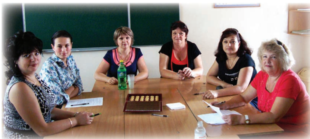
Депутатки – учасниці фокус-групового дослідження, 2013 р.

Отже, впливовість у публічній сфері має позитивний вплив на авто- ритет жінки у сім'ї та є прикладом ді- алектичного характеру владних стосун- ків та співвідношення статусів. Жінки відзначають наявність поваги від ото-