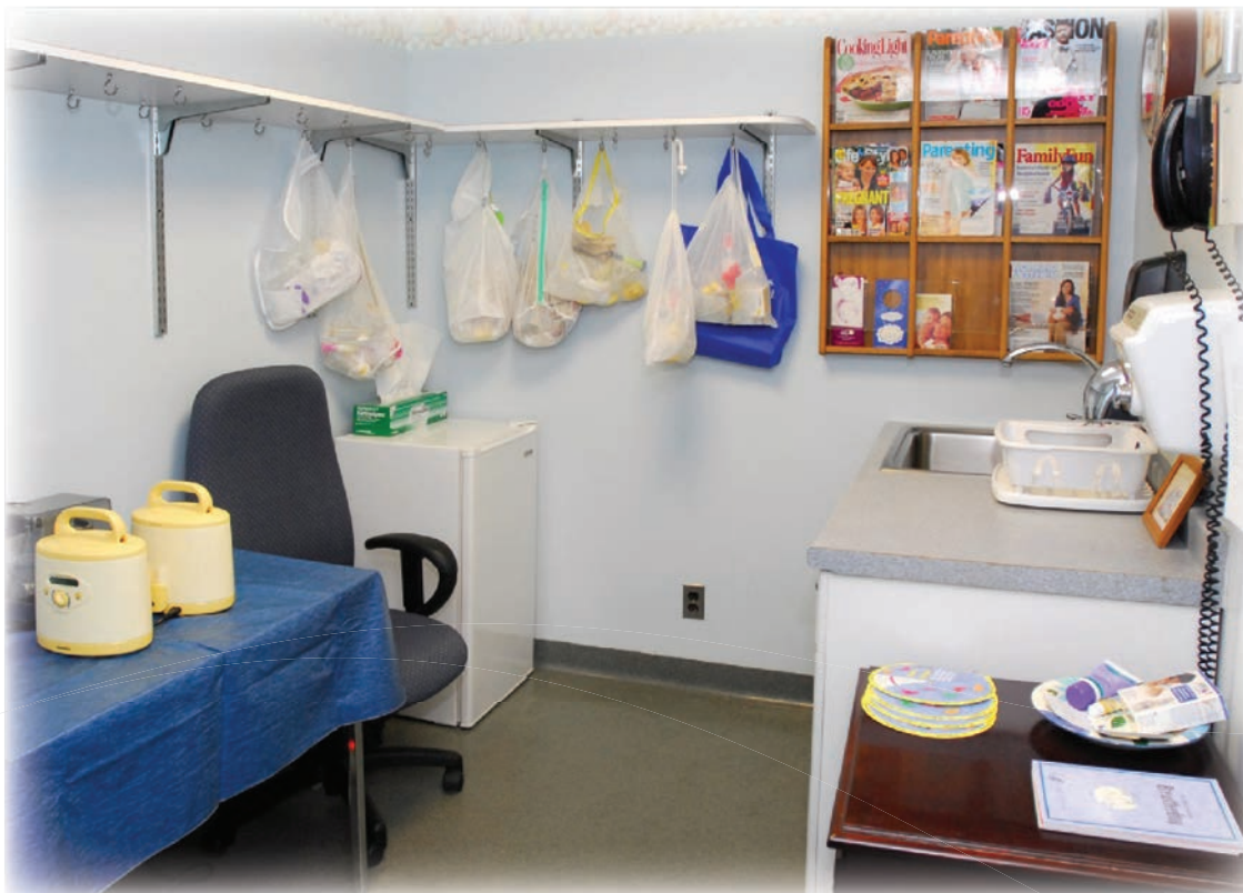
Приклад спеціально обладнаної кімнати для годівлі грудьми «на робочому місці»

Коли Британська Рада звертається до поняття рівних можливостей та розмаїття, то наводить 7 основних сфер: стать, фізичні вади, вік, раса / етнічне походження, релігія і вірування, сексуальна орієнтація, баланс між роботою та дозвіллям. Британська Рада вважає, що дискримінація за будь-яким із цих критеріїв є неприпустимою. Працівники і працівниці можуть виконувати роботу різного виду незалежно від статі. Коли аплі-