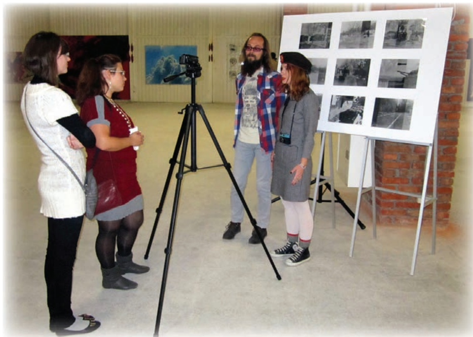
Бесіда з колективом Krolikovski Art

«війна»... Головною ідеєю, за словами самої авторки, є думка про те, що «ми готові до нового, ми хочемо нового»: «Дуже важливо минуле залишити в ми-