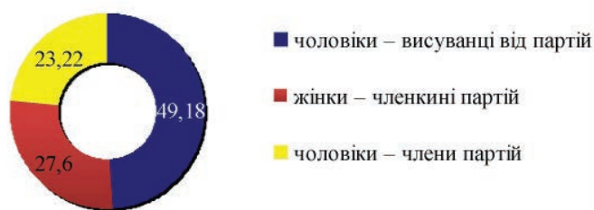
Рис. 2. Розподіл селищних та міських голів за статтю та партійною приналежністю (у %)

є простором регулярної взаємодії людей, об'єднаних почуттям колективної належності, спільним досвідом та інтересами. Оскільки виборчі округи представлені вулицею чи кількома багатопверховими будинками, соціальні мережі депутаток охоплюють увесь електорат, що сприяє їх обізнаності з проблемами колективного та індивідуального характеру, а також змушує працювати в умовах високого контролю та підзвітності.