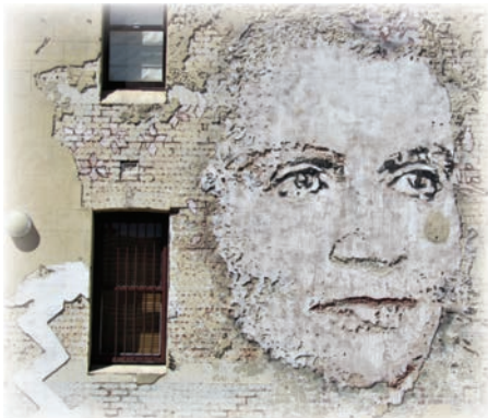
Дороті Тенгні (1911–1985) – перша жінка у складі Австралійського Сенату. Виконано у жанрі «настінної скульптури», Norfolk Hotel (Австралія), 2013 р.

німося до досвіду Хорватії , де серед основних чинників, що впливали на визначення ролі жінок у суспільстві можна виокремити повернення до традиційних поглядів на роль жінки та рух проти «прямої емансипації», що особливо загострилися в умовах хорватської війни за незалежність 1991-1995 років, коли влада була сконцентрована в руках традиціоналістського Хорватського Демократичного Союзу (ХДС) на чолі з Франьо Туджманом. Суспільно-політична активність жінок зводилася до антивоєнних рухів і створення організацій матерів. У 90-х рр. рівень представництва жінок у парламенті Хорватії був одним із найнижчих у Східній Європі. Троє перших виборів до хорватського парламенту відбувалися за різними системами: змішаною і пропорційною. Утім представництво жінок у парламенті залишалося на низькому рівні, адже партії завжди впливали на номінацію кандидатів, а завдяки дослідженню громадської думки партійні лідери знали, які місця в списку або округи є виграшними. Крім того, хорватські виборці зазвичай голосують