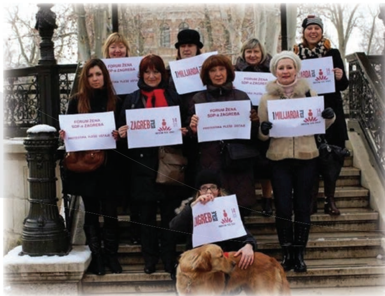
Соціал-Демократичний Жіночий Форум (Хорватія) з підтримкою кампанії «One billion rising», направленою проти насильства щодо жінок

у Верховній Раді знаходяться два законопроекти щодо введення гендерного квотування: № 3411, поданий О. Кондратюк, М. Томенком, В. Кличком та І. Геращенко 21 , а також № 3411-1 І. Бережної, І. Єремєєва, Н. Шуфрича, О. Ляшка 22 . Ці законопроекти пропонують різну квоту: перший – 40 % і 30 %, а другий – 35 %. Слід відзначити, що законопроект № 3411 вносить, так би мовити, «прогресивну» квоту: у першій п'ятірці не може бути більше трьох представників однієї статі, а далі – не більше семи в кожній десятці. Також слід відзначити, що законопроект № 3411-1 говорить про 35 %-ову квоту для всього списку, а № 3411 – для кожної окремої десятки. Як свідчить досвід інших країн, квотування, що стосується списку загалом, є малоефективним, адже партії зазвичай ставлять жінок у непрохідну частину списку. З огляду на сучасні міжнародні вимоги до України шанси ухвалення гендерного квотування є досить імо-